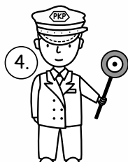
4. Pracownik kolei.