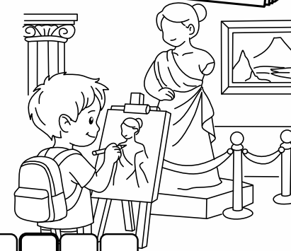
Uczeń rysuje w muzeum sztuki.