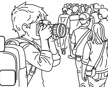
Kuba fotografuje uliczny tłum.