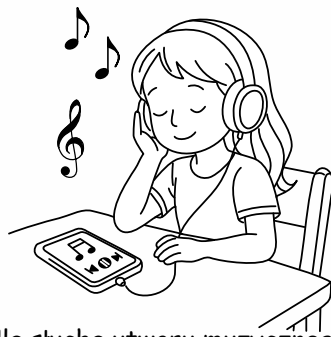
Ula słucha utworu muzycznego.