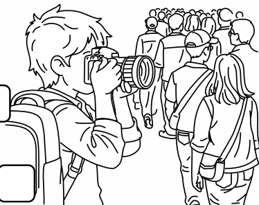
Kuba fotografuje uliczny tłum.