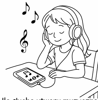
Ula słucha utworu muzycznego.