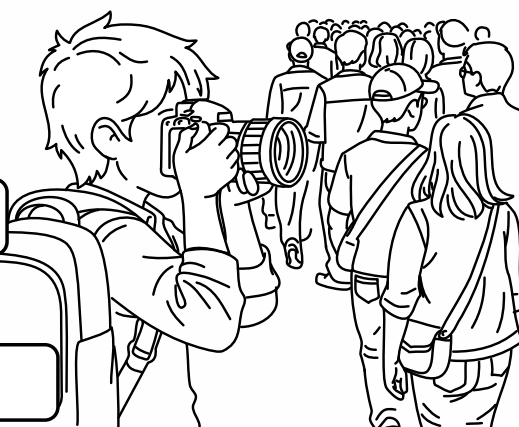
Kuba fotografuje uliczny tłum.