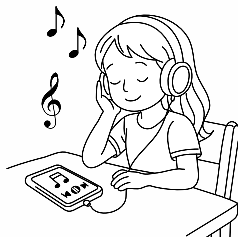
Ula słucha utworu muzycznego.